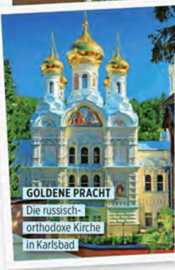
GOLDENE PRACHT Die russisch-orthodoxe Kirche in Karlsbad

INFO: 3 Ü/F im Spa Resort Sanssouci (Karlsbad) ab 253 Euro/DZ, z. B. über www.tui.com