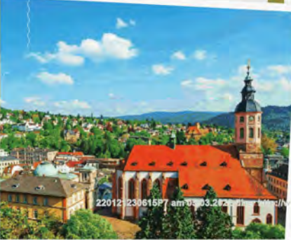
22012 230615P7 am 03.03.2011 www.kunster-konk.de

INFO: 1 Nacht im Hotel am Markt ab 110 Euro pro Doppelzimmer, www.hotel-am-markt-baden.de