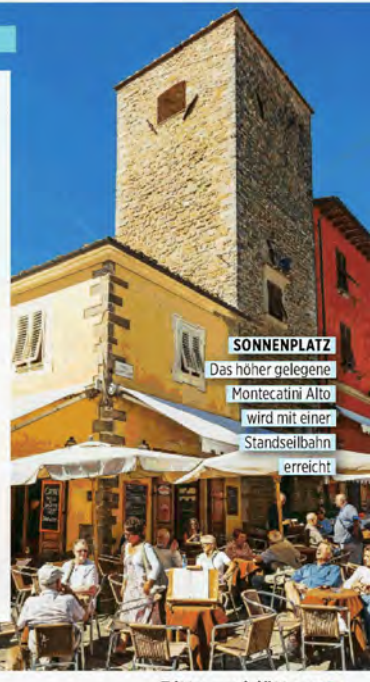
SONNENPLATZ Das höher gelegene Montecatini Alto wird mit einer Standseilbahn erreicht

INFO: 3 Ü/HP im Hotel Manzoni Wellness & Spa ab 450 Euro/DZ, z. B. über www.booking.com