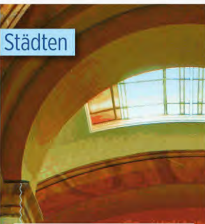
SCHMUCKSTÜCK Die Marktkolonnade in Karlsbad ist kunstvoll verziert